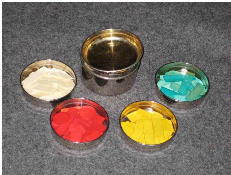
Figur 2. Virapulla med spelmarker

Givaren blandar den ena kortleken och ger den till spelaren till höger för att kuperas. Korten delas sedan ut medsols med början hos förhand, först ett varv med fyra kort till varje spelare, därefter tre varv med tre kort tills alla spelare fått tretton kort var. De resterande tretton korten bildar talongen och placeras mitt på bordet med baksidan upp. När givaren har lagt ner talongen på bordet, får spelarna ta upp korten på handen och sortera dem. Korten skall förstås hållas med baksidan vänd mot övriga spelare, så att bildsidan inte exponeras.