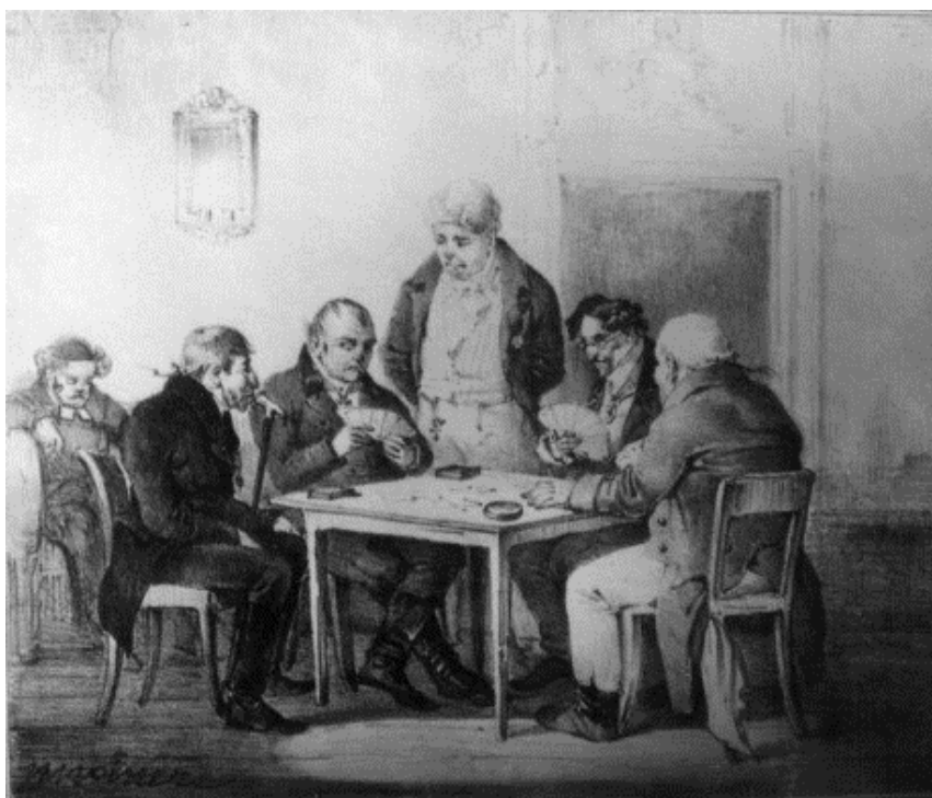
Figur 5. "Vira". Litografi från "Stockholmska scener" av Hjalmar Mörner, tryckt 1830.

Det enda bud där kraven för att få passa är allmänt accepterade bland alla spelsällskap är gök. Den spelare som står först i tur att tala sedan en gök bjudits, den första handen , måste ha minst två låggarder (i olika färger) för att få passa av budet. Den eventuellt kvarvarande spelaren, den andra handen , måste ha minst en låggard. Om en gök spelas hem och någon av motspelarna inte kan uppvisa erforderligt antal låggarder, måste den felande spelaren sätta en bet i pullan som straff. Om båda motspelarna har passat av en hemspelad gök utan att uppfylla kraven, gäller i vissa kretsar att båda spelarna måste sätta bet, medan i andra, till exempel Stockholms Wirasällskap, att de felande spelarna slipper böta.