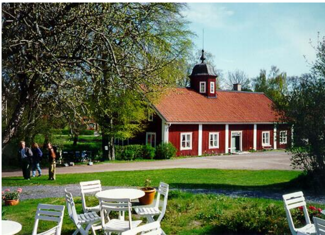
Figur 4. Tingshuset i Vira bruk. Enligt en gammal muntlig tradition i Roslags-Kulla uppfanns vira i början av 1800-talet, sedan deltagarna vid ett ting som hölls här hade isolerats av ett snöoväder.

Anser någon av motspelarna att läget är utsiktslöst, har hen rätt att fråga sin partner om denne vill ge upp. Om partnern går med på detta, är spelföraren hemma. I annat fall går spelet vidare.